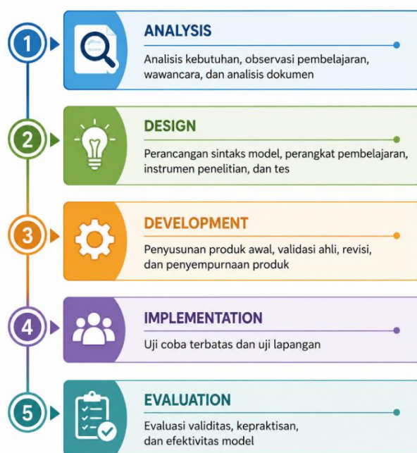
Gambar 1. Tahapan Pengembangan Model ADDIE

Tahap evaluation dilakukan untuk menilai kualitas model pembelajaran yang dikembangkan. Evaluasi dilakukan berdasarkan hasil validasi ahli, peningkatan kemampuan pemecahan masalah matematika mahasiswa, aktivitas mahasiswa selama proses pembelajaran, serta respons mahasiswa terhadap penerapan model pembelajaran sosial berbasis strategi metakognitif. Tahapan pengembangan model ADDIE disajikan pada Gambar 1.