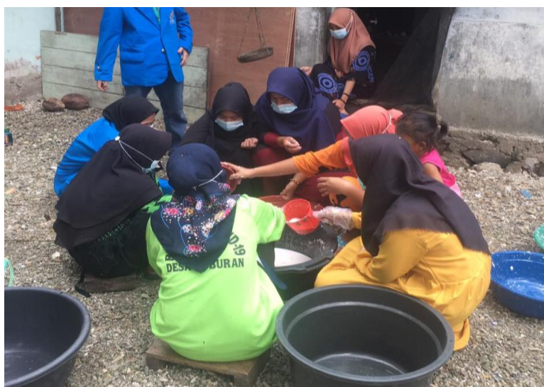
Gambar 3. Sesi Pembagian Kelompok Kerja

Materi kelas kedua disampaikan tentang pentingnya penguatan pemahaman tentang konsep-konsep utama dari pemberdayaan dan penguatan kelompok dengan pendekatan kewirausahaan sosial ( sociopreneurship ). Nilai dasar utamanya adalah usaha berbasis komunitas yang memiliki dan menjunjung nilai-nilai sosial melalui aktifitas kewirausahaan petani. Femina (dalam Tanjung, 2021) menyimpulkan bahwa kompetensi dalam sociopreneurship harus membantu menyelesaikan permasalahan sosial. Kompetensi selanjutnya harus mencari hal atau membuat perubahan yang lebih baik dan menyelesaikan masalah dengan mengubah sistem, menyebarkan solusi dan meyakinkan orang lain untuk ikut terlibat dalam melakukan perubahan. (2) Pembagian kelompok, dalam tahap ini ibu-ibu PKK dibagi menjadi 3 Kelompok Oil untuk memudahkan dalam pelaksanaan program dan mempererat kerjasama antara tim dan ibu-ibu PKK. Masing-masing kelompok akan dipandu oleh anggota tim saat pelaksanaan nanti.