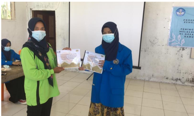
Gambar 2. Penyerahan Booklet Pengolahan Coconut Oil

coconut oil di Desa Buburan. Dalam sesi ini dijelaskan pentingnya mengembangkan kreativitas ibu-ibu PKK melalui pembuatan Coconut Oil .