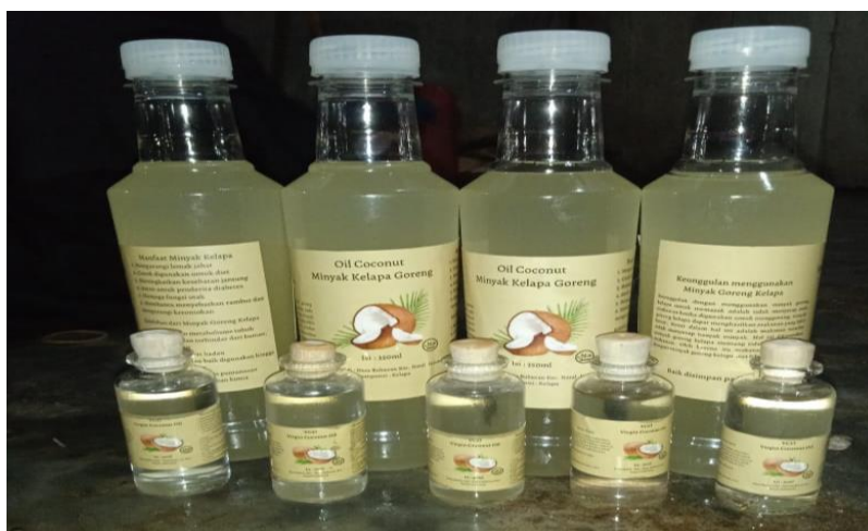
Gambar 4. Pengemasan Coconut Oil dan Virgin Coconut Oil

Schetter (dalam Palupi, 2017) pelatihan ketrampilan sosial ( social skills training ) dapat membawa perbaikan fungsi sosial dalam suatu hubungan manusia dan juga meningkatkan perasaan baik seseorang terhadap dirinya sendiri. (3) Pengajaran ( learn ), dilakukan kunjungan langsung ke Desa Buburan, dengan tetap menerapkan protokol kesehatan Covid-19 bersama mitra dengan tahapan: mitra memahami cara pemanfaatan kelapa menjadi Coconut Oil dan Virgin Coconut Oil (VCO), dan mitra menerima booklet dan buku pedoman dari tim agar mitra lebih memahami cara pembuatan Coconut Oil dan Virgin Coconut Oil . (4) Praktik ( practise ), pertama, tim memberikan pelatihan pembuatan Coconut Oil dan Virgin Coconut Oil (VCO) kepada mitra dengan melakukan protokol kesehatan Covid-19. Hasil dari tahapan ini menunjukkan kemampuan mitra dalam menghasilkan produk Coconut Oil dan Virgin Coconut Oil (VCO). Kedua, Tim PKM-PM melakukan pelatihan pengemasan Coconut Oil dan Virgin Coconut Oil (VCO). Hasil dari tahapan ini menunjukkan bahwa mitra mampu mengemas produk Coconut Oil dan Virgin Coconut Oil (VCO). Ketiga, tim PKM-PM melakukan pendampingan pemasaran produk olahan Coconut Oil dan Virgin Coconut Oil (VCO). Hasil dari tahapan ini menunjukkan bahwa mitra mampu memahami pemasaran Coconut Oil dan Virgin Coconut Oil (VCO).