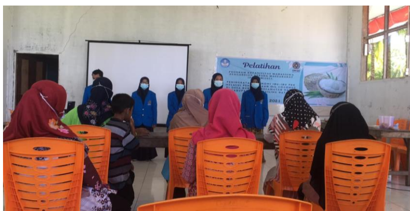
Gambar 1. Sosialisasi Program

Tahap pelaksanaan , dilakukan (1) Sosialisasi tim dan program pelatihan Coconut Oil dan Virgin Coconut Oil (VCO) . Pada bulan Juni, tim kembali ke Desa Buburan guna menyampaikan sosialisasi perencanaan program kemitraan masyarakat dengan pelatihan pembuatan Coconut Oil di Desa Buburan.