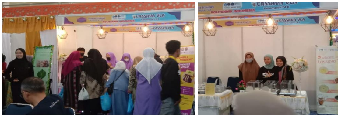
Gambar 7. Dokumentasi Kegiatan Expo

Pertemuan ke-15 kegiatan pada pekan kelima belas masing-masing kelompok mempersiapkan laporan akhir kegiatan mereka. DPL melakukan pertemuan via zoom kepada mahasiswa agar laporan kegiatan dapat mereka kerjakan dan selesaikan dengan baik. Adapun beberapa hal yang mereka tanyakan terkait keuntungan yang mereka peroleh sebagai hasil penjualan yang didapatkan pada saat expo. Produk yang dipamerkan kelompok 74a terjual habis dan ini tentunya menjadi penyemangat ke depannya dapat terus melanjutkan kegiatan ini.