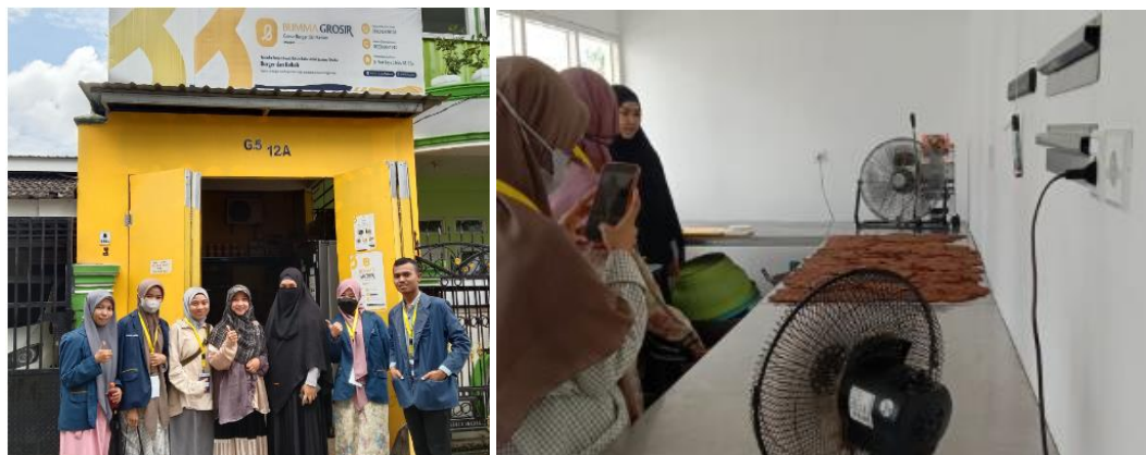
Gambar 6. On Bording DPL dan Mahasiswa Kelompok 74B ke UMKM Bumma Grosir ( Boddy Foods )

banyak UMKM yang menghentikan usahanya berbanding terbalik dengan mereka. Usaha ini justru mereka inovasi ke makanan siap saji yang telah dikemas. Hanya dipanaskan beberapa menit, lalu siap disajikan. Kami juga diberi kesempatan untuk berkunjung ke tempat produksinya. Usaha mereka telah berjalan lebih dari 3 tahun dengan omset yang dihasilkan lebih dari 200 juta.