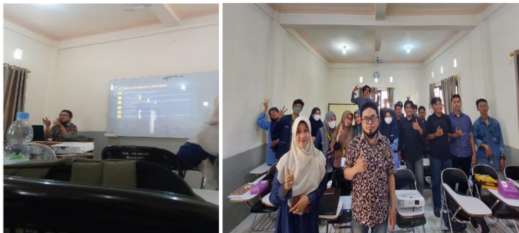
Gambar 2. Aktifitas Workshop 3 dan 4

( organizing ), pengarahan ( actuating ), dan pengendalian ( controlling ). Topik ini membahas bagaimana pengambilan keputusan yang strategis guna memperluas barang atau produk pada sebuah perusahaan. Pembahasan akan dimulai dengan membahas pengertian pemasaran secara umum dan menurut para ahli, ruang lingkup pemasaran, siapa yang memasarkan dan konsep inti dari pemasaran. Selanjutnya materi kedua mengenai manajemen pelanggan.