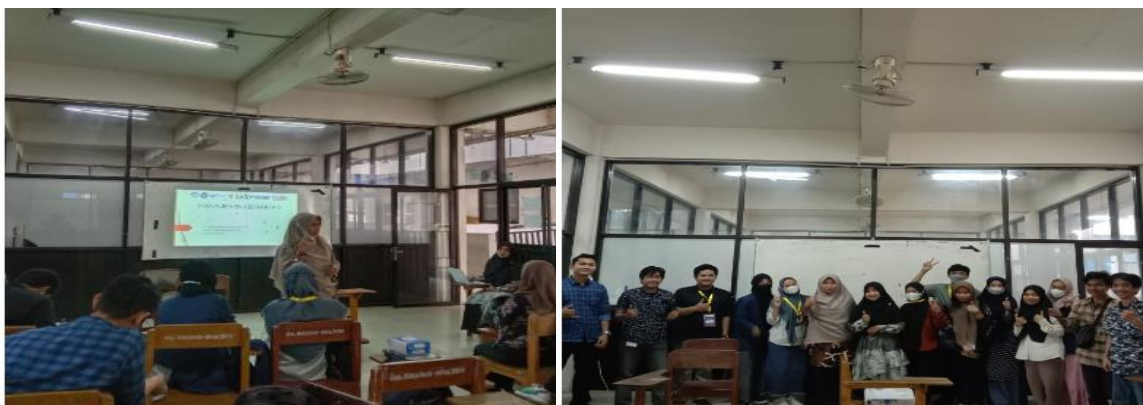
Gambar 3. Aktivitas Workshop 5 dan 6

Pertemuan ke-5 mahasiswa diberi kesempatan untuk mengemukakan rencana wirausaha yang mereka akan buat setelah mengikuti kegiatan workshop 1 sampai 6. Evaluasi ide wirausaha yang DPL lakukan via google meet . Selanjutnya pertemuan ke-6 masing-masing kelompok yang terdiri dari 5 orang. Setiap kelompok diberi kesempatan untuk mempersiapkan kunjungan yang akan dilakukan ke UMKM. Persiapan yang dilakukan mahasiswa adalah mencari UMKM di sekitar tempat tinggal mereka yang dapat dikunjungi dan tentunya sejalan dengan bentuk usaha yang mereka rencanakan. Evaluasi rencana kunjungan ke UMKM dan rancangan proposal yang DPL lakukan via google meet .