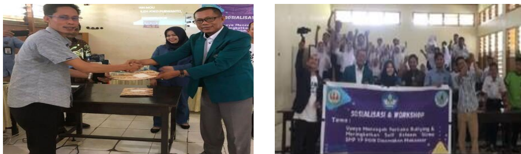
Gambar 8. Pembentukan Kelompok dan Komitmen Sekolah Bebas Bullying

Pada akhir sesi ini dilakukan pembentukan kelompok penyadar yang bertugas untuk mencegah perilaku bullying, seperti tampak pada Gambar 8 berikut.