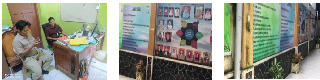
Gambar 1. Observasi dan Wawancara

Tahapan Persiapan. Pada tahapan perencanaan kegiatan ini yaitu persiapan berupa kegiatan observasi dan wawancara pada lokasi kegiatan yaitu SMP YP PGRI Disamakan Makassar. Observasi dilakukan terkait kondisi lingkungan sekolah, interaksi siswa dan wawancara dengan guru BK.