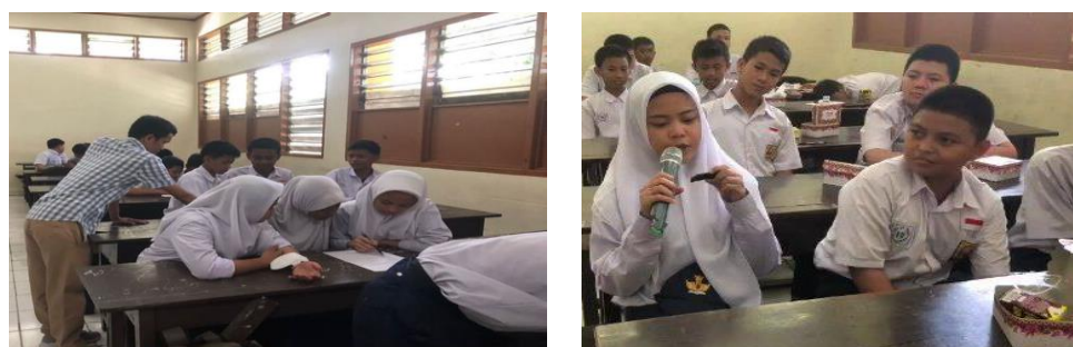
Gambar 6. Materi Sesi 4 (Post Tes dan FGD)

Evaluasi dan Pembentukan Kelompok. Tahap keempat dilakukan proses diskusi terkait pengetahuan dan sikap siswa setelah memperoleh materi dan praktek yang dilakukan oleh dosen pengabd. Yang dirangkaikan dengan kegiatan evaluasi yaitu dengan memberikan soal post tes yang dilanjutkan dengan diskusi seperti tampak pada Gambar 6 berikut.