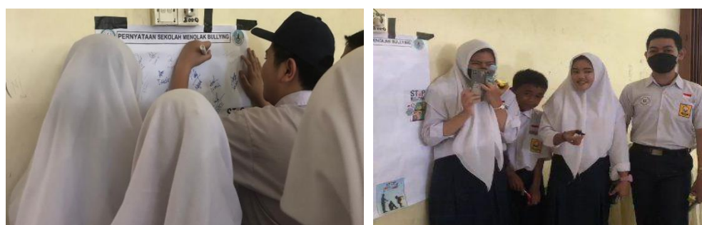
Gambar 7. Penandatanganan Penolakan Bullying

Selanjutnya kegiatan dilanjutkan dengan penandatanganan secara bersama aksi untuk menolak perilaku bullying, seperti tampak pada Gambar 7 berikut.