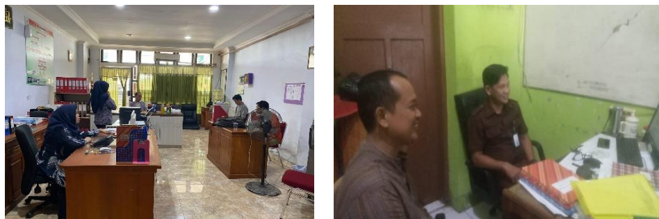
Gambar 2. Rapat Tim dan Konsultasi Hasil Rapat Tim

Selanjutnya dilakukan rapat untuk merencanakan tema dan teknis kegiatan serta membicarakan terkait waktu pelaksanaan kegiatan, seperti pada Gambar 2 berikut.