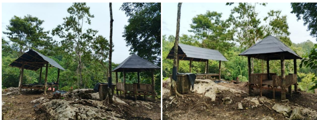
Gambar 2. Hasil Pembangunan Gazebo di Objek Wisata Tondon

Kegiatan lain yang turut dilaksanakan selama program KKN-T adalah kegiatan gotong royong atau Jumat bersih bersama masyarakat setempat. Kegiatan ini bertujuan untuk menjaga kebersihan lingkungan sekaligus mempererat hubungan antara mahasiswa KKN dengan masyarakat Kelurahan Bebo'. Melalui kegiatan gotong royong, mahasiswa dan masyarakat bekerja sama membersihkan lingkungan sekitar objek wisata serta area permukiman. Selain itu, kegiatan ini juga menjadi sarana untuk membangun kerja sama yang baik antara mahasiswa dan masyarakat dalam mendukung berbagai program yang dilaksanakan.