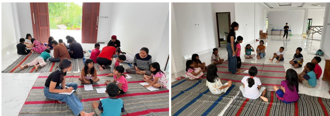
Gambar 1. Suasana Pembelajaran Menggunakan Media Flipbook di TK Mitra

Tingkat kehadiran siswa TK selama program berlangsung juga mencerminkan penerimaan yang positif. Pada minggu pertama, kehadiran tercatat sebesar 85,2% (23 dari 27 siswa), meningkat menjadi 92,6% pada minggu kedua (25 siswa), dan mencapai kehadiran penuh 100% pada minggu ketiga. Rata-rata kehadiran selama tiga minggu pelaksanaan program sebesar 92,6% mengindikasikan bahwa siswa TK termotivasi untuk mengikuti kegiatan pembelajaran secara konsisten. Beberapa orang tua menyampaikan apresiasi karena anak-anak mereka menunjukkan perubahan positif (Islami, 2025; Jayadinata et al., 2024), seperti meningkatnya semangat belajar dan kebiasaan belajar di rumah setelah mengikuti kegiatan pembelajaran berbasis flipbook .