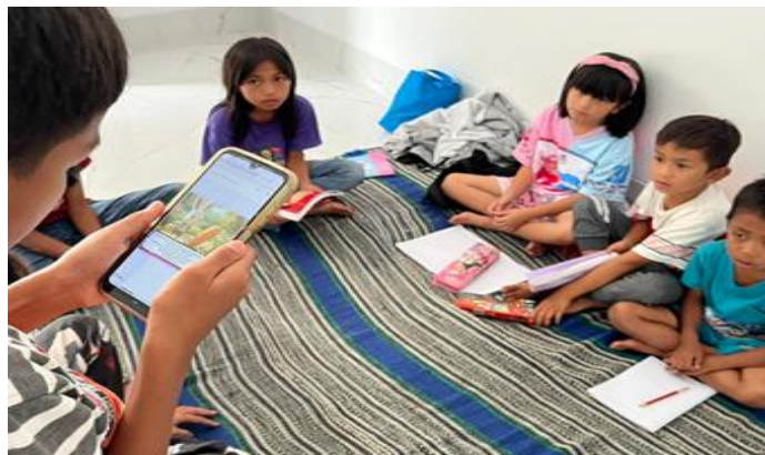
Gambar 2. Suasana Pengujian Media Flipbook oleh Siswa TK di Salah Satu Sekolah Mitra

Efektivitas penggunaan flipbook diukur melalui kuesioner kepuasan yang diberikan kepada guru kelas dari kedua sekolah mitra (n=4 guru) pada akhir minggu ketiga pelaksanaan program, setelah seluruh sesi pembelajaran berbasis flipbook selesai dilaksanakan. Kuesioner disusun menggunakan skala Likert 1–4 (1=kurang baik, 2=cukup baik, 3=baik, 4=sangat baik) yang mencakup lima aspek penilaian, yaitu: (1) kesesuaian materi flipbook dengan kurikulum TK; (2) kemudahan penggunaan media oleh guru; (3) respons dan keterlibatan siswa selama penggunaan flipbook ; (4) kejelasan tampilan visual dan keterbacaan konten; serta (5) potensi keberlanjutan penggunaan flipbook dalam pembelajaran rutin. Hasil evaluasi menunjukkan skor rata-rata sebesar 92,8% dengan kategori sangat baik, yang mengindikasikan bahwa guru menilai media flipbook layak dan efektif digunakan sebagai media pembelajaran di tingkat TK.