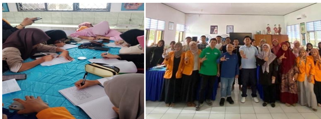
Gambar 2. Kegiatan Menulis Puisi dan Foto Bersama Tim Pengabdian bersama Guru

Keterlibatan siswa dalam proses menemukan ide, menyusun draf, menerima umpan balik, dan merevisi karya memperlihatkan bahwa menulis sastra berperan penting dalam merangsang kreativitas sekaligus perkembangan kognitif. Creative writing dapat menstimulasi kreativitas, keterlibatan belajar, dan perkembangan kognitif karena proses menulis menuntut peserta didik menghubungkan pengalaman, memilih gagasan, mengembangkan imajinasi, serta menyusun struktur ekspresi secara sadar (Sudirman, 2025). Sejalan dengan itu, Fitria (2024) memandang creative writing sebagai bentuk penulisan inovatif yang memberi ruang bagi narasi, pengembangan karakter, imajinasi, opini, dan gaya bahasa ekspresif. Dalam kegiatan PKM ini, pandangan tersebut tampak ketika siswa mulai menjadikan pengalaman personal sebagai sumber penciptaan puisi dan mengembangkan pengamatan terhadap kehidupan sosial menjadi konflik dalam cerpen.