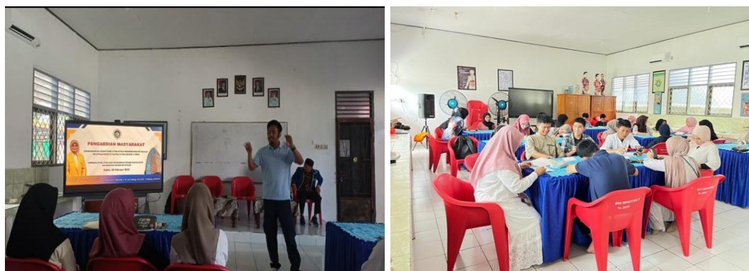
Gambar 1. Kegiatan Penguatan Literasi dan Proses Kreatif Menulis Cerpen

Berdasarkan Tabel 1, hasil pertama menunjukkan adanya peningkatan pemahaman siswa terhadap makna literasi. Pada awal kegiatan, sebagian siswa masih memahami literasi secara terbatas sebagai kegiatan membaca buku atau memahami isi bacaan. Setelah mengikuti pelatihan, siswa mulai memahami bahwa literasi juga mencakup kemampuan menulis, menafsirkan pengalaman, mengolah gagasan, memilih bentuk ekspresi, dan menghasilkan karya. Perubahan pemahaman ini penting karena literasi dalam pendidikan modern tidak hanya menekankan kemampuan memperoleh informasi, tetapi juga kemampuan menggunakan teks untuk berpikir, berefleksi, dan berpartisipasi dalam kehidupan sosial. OECD (2023) menegaskan bahwa literasi membaca mencakup kemampuan memahami, menggunakan, mengevaluasi, merefleksikan, dan terlibat dengan teks untuk mencapai tujuan serta berpartisipasi dalam masyarakat. Dalam konteks kegiatan ini, keterlibatan dengan teks diwujudkan melalui aktivitas membaca contoh puisi dan cerpen, mendiskusikan makna, menulis karya, merevisi tulisan, serta membacakan atau mempresentasikan karya di hadapan teman.