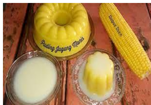
Gambar 5. Contoh Produk Sup Jagung Manis

Ketiga , Teknik Branding dan Marketing. Salah satu penyebab kegagalan dalam berwirausaha adalah sistem pemasaran dan branding yang tidak dilakukan secara maksimal. Kedua faktor tersebut sangat penting bagi pertumbuhan dan perkembangan suatu usaha. Perlu diingat bahwa se bagus apapun produk yang dijual, tanpa didukung oleh strategi iklan yang menarik, maka orang tidak akan tertarik untuk membeli. Branding adalah berbagai kegiatan yang ditujukan untuk membangun dan meningkatkan identitas merek, yang mencakup nama dagang, logo, karakter, dan persepsi konsumen terhadap merek tersebut. Branding juga merupakan strategi baru bagi perusahaan untuk menarik dan mempertahankan konsumen (Sulistio, 2021). Sementara itu, marketing lebih terfokus pada bagaimana strategi pemasaran yang diterapkan dapat digunakan untuk menciptakan hubungan antara perusahaan dan pelanggan. Strategi pemasaran adalah seperangkat tujuan dan sasaran, praktik dan aturan yang memberikan arah pada upaya pemasaran dari waktu ke waktu, pada tingkat tertentu dan dengan referensi dan atribusi, terutama sebagai tanggapan perusahaan terhadap lingkungan dan pesaing yang selalu berubah (Ulpah, 2021).