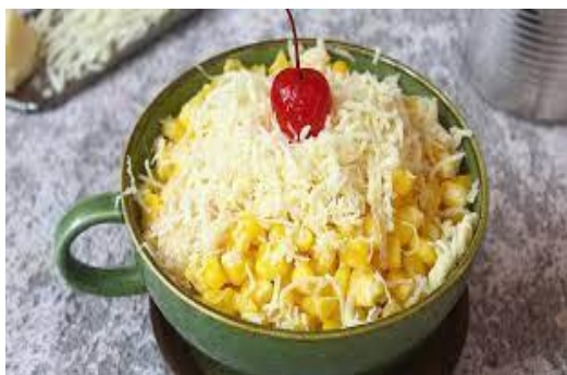
Gambar 2. Contoh Produk Jasuke