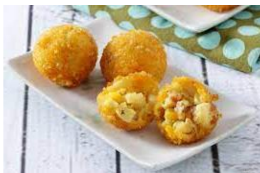
Gambar 4. Contoh Produk Sup Jagung Manis