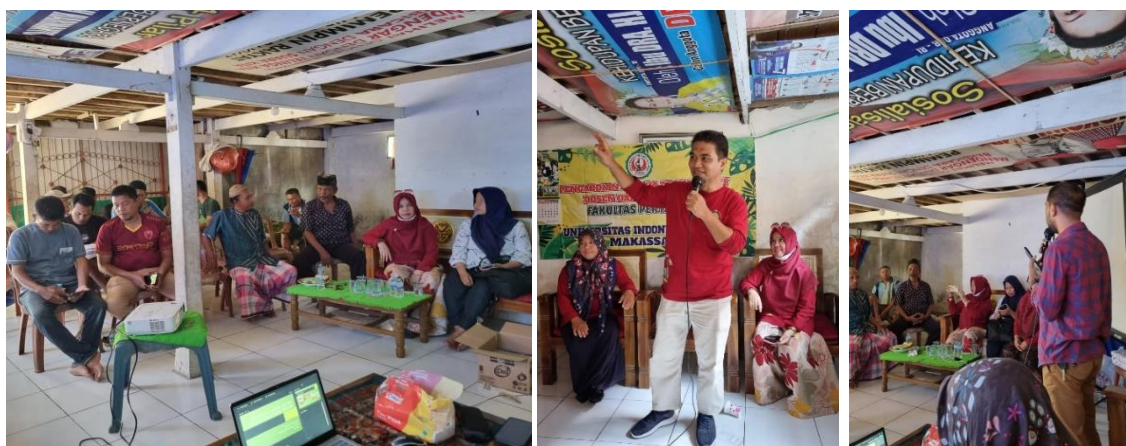
Gambar 1. Kegiatan Pemberian Materi Penyuluhan

Kegiatan pengabdian masyarakat ini merupakan upaya untuk memberikan edukasi dan wawasan tentang agroindustri dan pengolahan produk jagung agar menghasilkan nilai jual. Kegiatan tersebut dilaksanakan pada 27 Mei 2023. Adapun tempat penyuluhan berlokasi di Balai Desa Tarowang, Kecamatan Galesong Selatan, Kabupaten Takalar. Pemberian materi penyuluhan dilakukan oleh Tim Dosen Pengabdian Masyarakat. Hal tersebut sebagaimana disajikan pada Gambar 1 berikut.