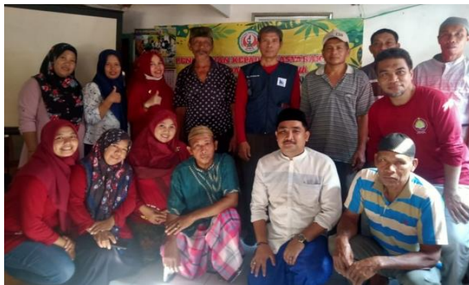
Gambar 6. Foto Beberapa dengan Perwakilan Peserta Penyuluhan

Perlu diketahui bahwa kebiasaan masyarakat di Desa Tarowang dalam mengolah jagung hanya direbus atau dicampur dengan sayuran saja, sehingga mereka tidak berpikir untuk mengolah makanan dengan cita rasa yang berbeda. Peserta pelatihan juga diberikan kesempatan untuk berdiskusi/bertanya setelah pemaparan materi.