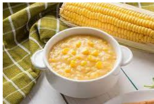
Gambar 3. Contoh Produk Sup Jagung Manis